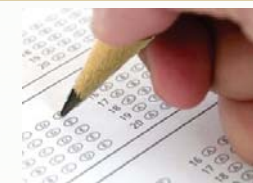
Estudio de una asignatura mensualmente, realizándose el examen al finalizar éste.

Las pruebas de examen se componen de dos partes: una batería de 20 preguntas tipo test, la mayoría pertenecientes a la batería de 120 preguntas entregadas al inicio de la asignatura; y uno de los casos prácticos planteados, extraído también del material inicial entregado.