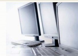
Tutorías on line con cada profesor de la asignatura.

El programa se imparte siguiendo el modelo docente a distancia en régimen de tutorías. Al comienzo de cada asignatura se entrega una batería de 120 preguntas tipo test, así como 4 supuestos prácticos con tres cuestiones a resolver.